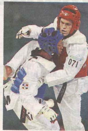
Combate de taekwondo